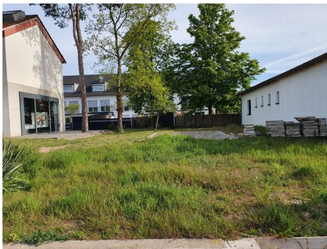
Aktuelle Ansicht des Geländes

Durch Aktivitäten und Spenden der vergangenen Jahre steht uns zurzeit ein Budget von € 4.026,70 zur Verfügung. Leider, leider reicht das nicht aus.